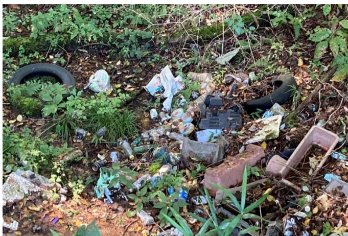
タイヤ・テレビ他(猪鼻峠コース)