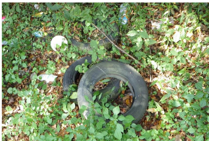
タイヤ等(タバコ峠コース)