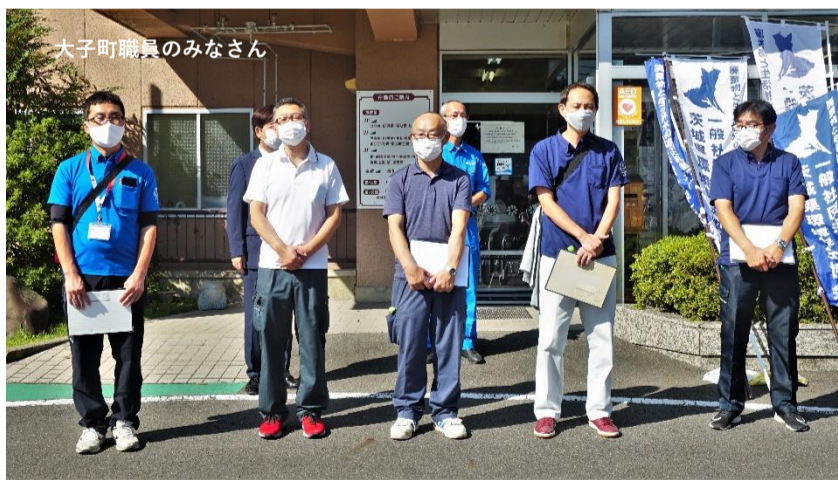
大子町職員のみなさん