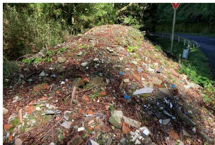
がれきを含む残土(猪鼻峠コース)