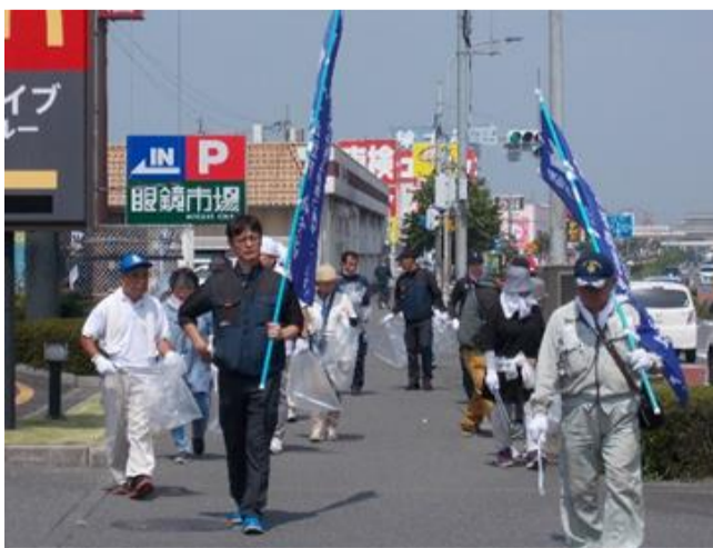
不法投棄パトロール及び道路清掃ボランティア