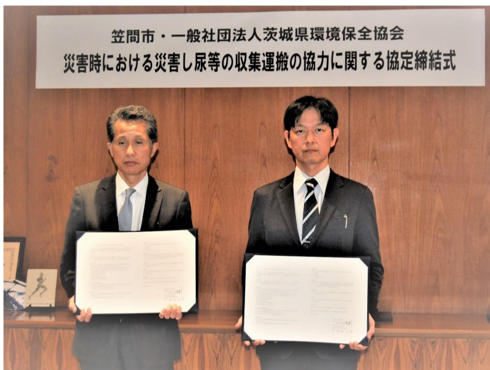
笠間市・一般社団法人茨城県環境保全協会 災害時における災害し尿等の収集運搬の協力に関する協定締結式