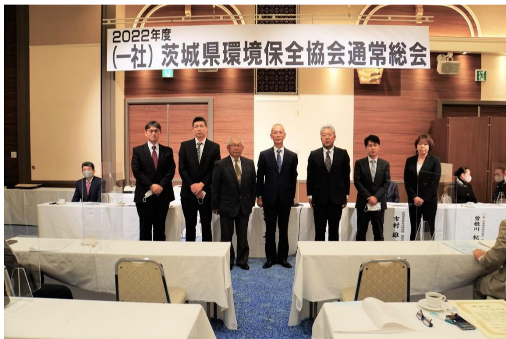
受賞者の皆さん(代理受賞者を含みます)