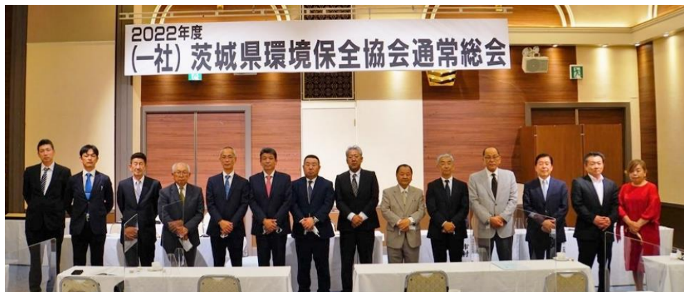
(別表)選出された新役員(写真順)